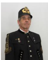
St. Molin Pokladník